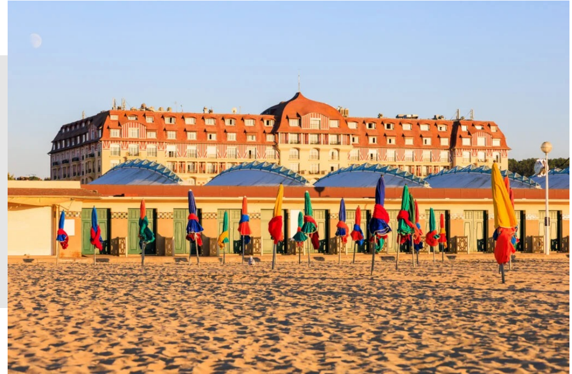
Plage de Deauville